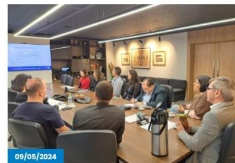
Caxias do Sul registra crescimento econômico de 10,6% no primeiro trimestre, mas enfrenta desafios com tragédia no RS