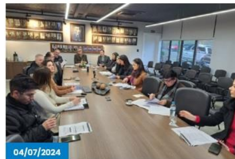
Tragédia climática no RS faz desempenho da economia de Caxias do Sul cair 7,2% em maio