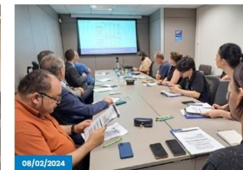
Economia de Caxias do Sul fecha 2023 com crescimento de 4,6%