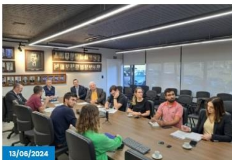
Economia de Caxias do Sul registra crescimento no mês de abril