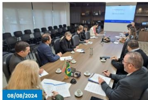
Economia de Caxias do Sul se recupera em junho e fecha semestre com alta acumulada de 7,5%