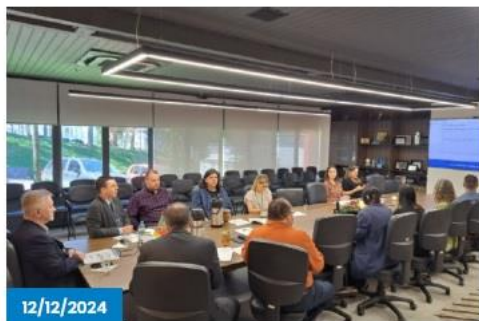
Economia de Caxias do Sul cresce 4,5% em outubro, impulsionada novamente pelos serviços